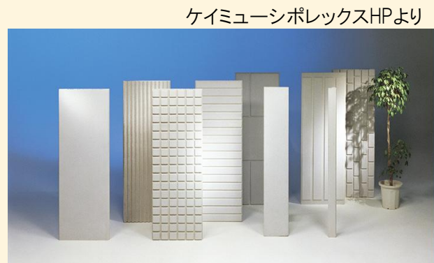
シポレックス栃木工場様との連携 「工業製品」製造への熱供給