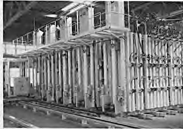
西那須野工場に整備された縦型プレス

トーセンでも、これまで集成材事業への参入はじめ、ユーザーニーズへの対応により事業の多角化を進めてきましたが、根底にあるのは、丸太の有効活用です。