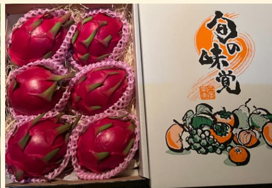
星の見える丘農園様との連携 「ドラゴンフルーツ栽培」への熱供給