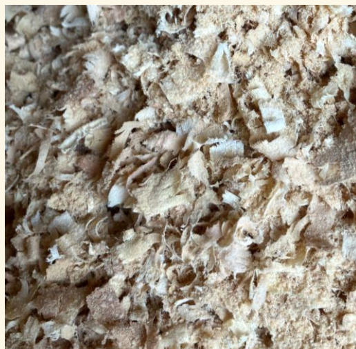
削った際の「カンナくず」「おが粉」