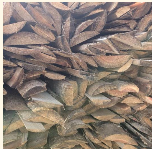
丸太の外側・丸み部分の「背板」